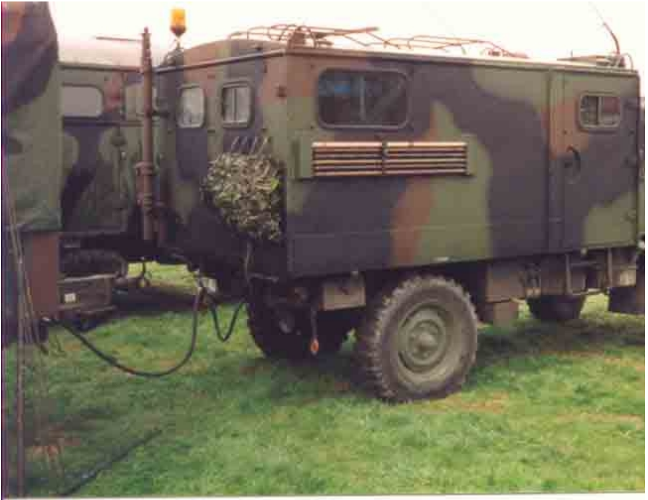
Unimog von rechts hinten