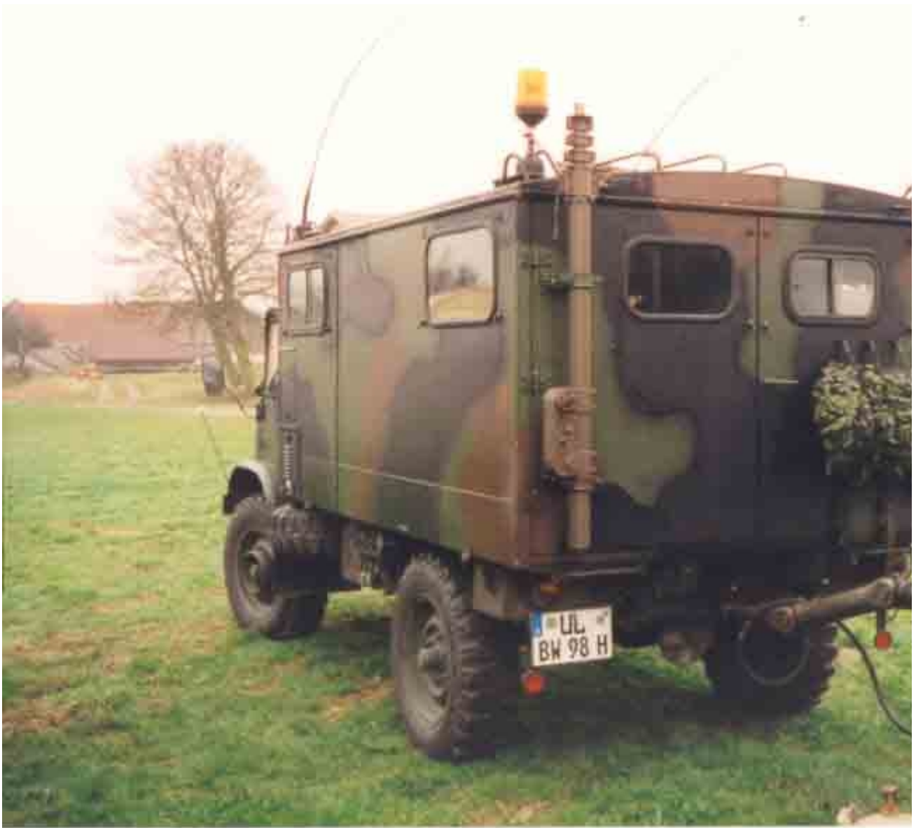
Unimog von links hinten mit Teil vom Hänger