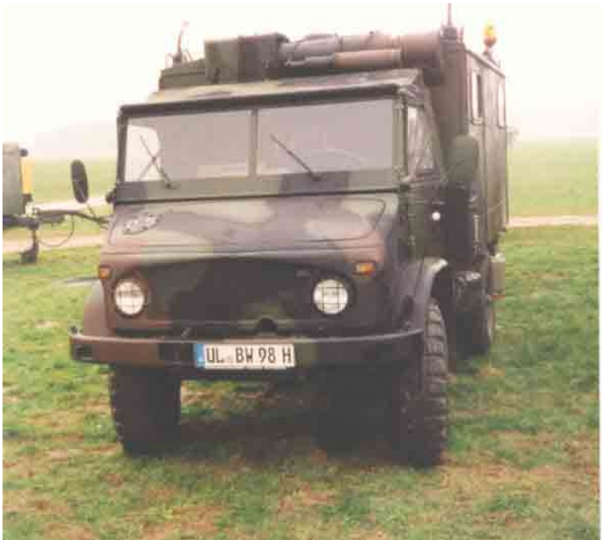
mein Unimog von vorn