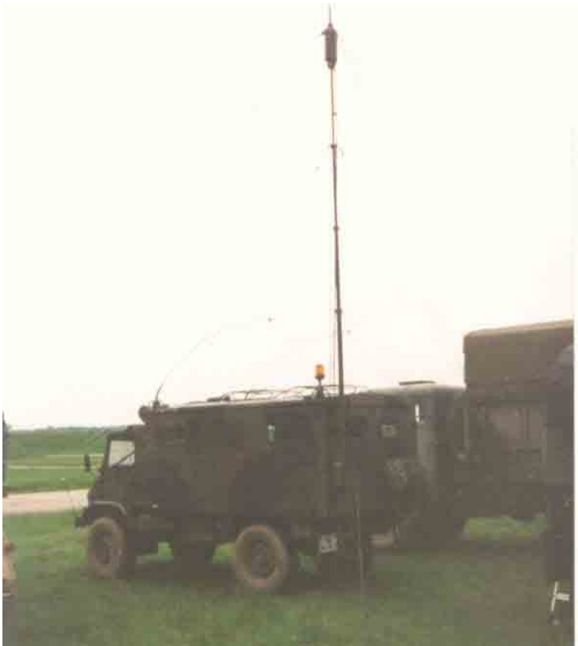
Unimog von hinten mit ausgefahrenem Kurbelmast im Hintergrund ein AEC Cargo