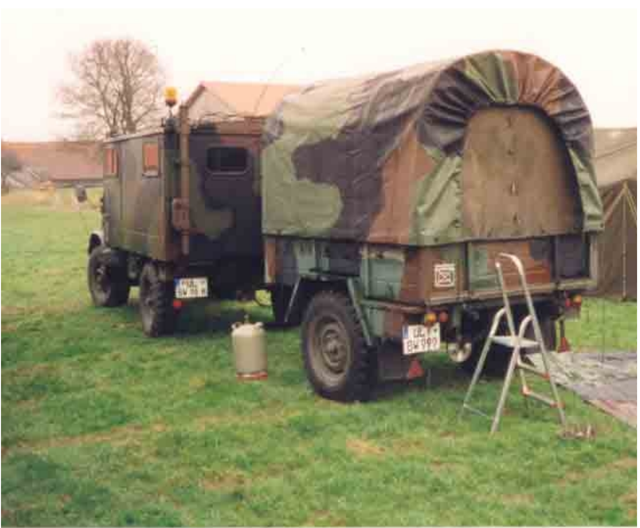
Unimog mit Hanger